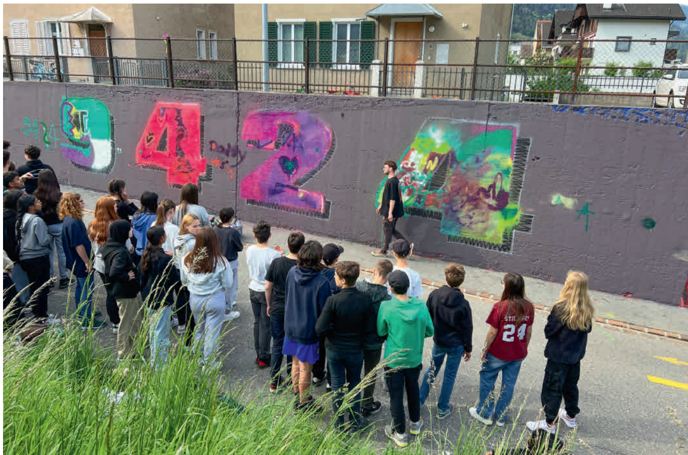
Die Rheinecker Postleitzahl 9424 ziert nun eine Wand in Chur.

Ein weiterer spannender Bestandteil der Woche war ein Rapworkshop, der schon einige Wochen zuvor startete und am Besuchsmorgen seinen Abschluss fand. Hier stellten die Schülerinnen und Schüler ihre sprachlichen und musikalischen Talente unter Beweis. Die Ergebnisse dieses Workshops wurden mit Begeisterung auf der Bühne der Aula präsentiert. Ebenfalls fand ein Showtanz-Event auf dem Neumülipausenplatz statt.