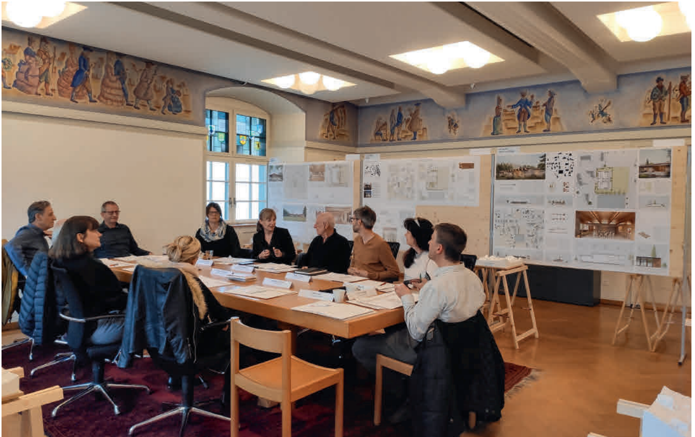
Das Preisgericht diskutierte rege über die zu beurteilenden Projekte.

deren Anordnung lassen einen attraktiven Kindergartenbetrieb zu. Durch die verspielte Ausgestaltung der Fassade wird das Gebäude als Kindergarten stimmig wahrgenommen. Der Aussenraum ist attraktiv gestaltet und bietet spannende Erlebnisse für die Kinder. Der Stadtrat schloss sich diesen Argumenten an und vergab die Arbeiten für die Planung an das erstrangierte Architekturbüro. Die prämierte Firma wird am 3. Juni anlässlich einer Pressekonzferenz vorgestellt.