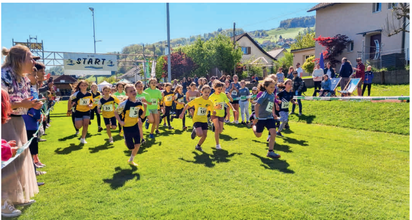
Alle Jahre wieder, die Jugi Rheineck am Thaler Crosslauf.

Bereits zur 9. Austragung gelangt am Samstag, 29. Juni 2024 das fisch-