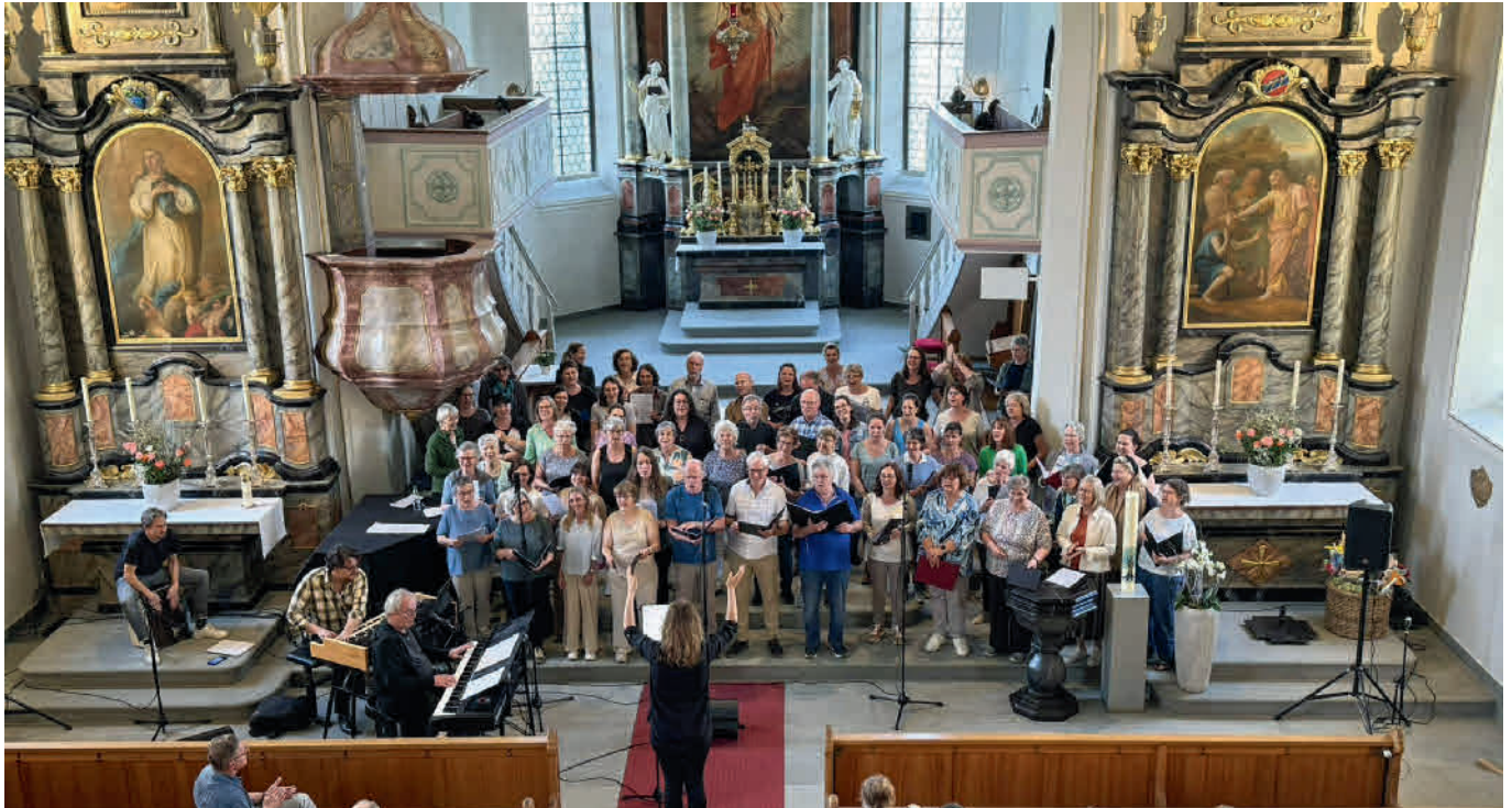
Lauter Gospelgesang hallte durch die Kirche Thal.