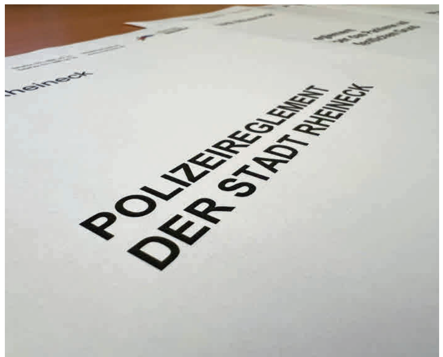
Gerade kürzlich wurde das veraltete Polizeireglement überarbeitet.

Einige Reglemente der Stadt Rheineck sind älter als zwanzig Jahre und müssen überholt werden. Diese Revisionen oder Anpassungen werden seitens Stadtkanzlei koordiniert und durchgeführt. Zuletzt wurde das Parkierreglement Ende 2023 angepasst. Gerade kürzlich wurde die Polizeiverordnung erneuert und auf einen aktuellen Stand gebracht. Ebenso muss das Benützungsgreglement für Schulanlagen überarbeitet werden. Reglementsänderungen unterstehen dem fakultativen Referendum und müssen öffentlich aufgelegt werden. Diese Auflagen werden jeweils auf der amtlichen Publikationsplattform sowie unserer Website und im Aushang vor dem Rathaus publiziert.