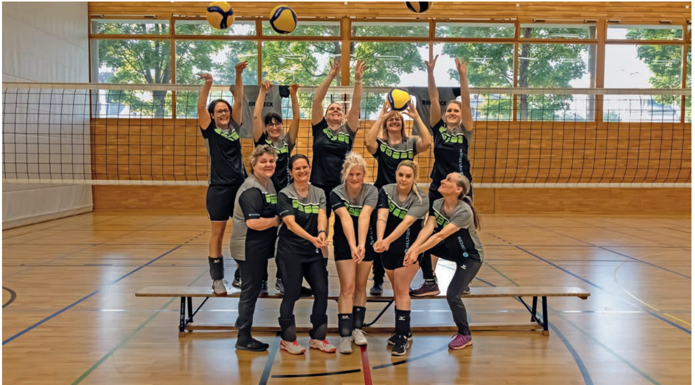
Top-Platzierungen erreichte das Volley Rheineck-Gruppe an der Plausch-Meisterschaft.