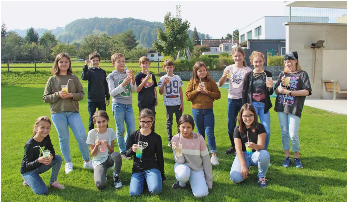
Die TeilnehmerInnen des Ferienpasses kamen in den Genuss einer spannenden, abwechslungsreichen Herbstferienwoche.