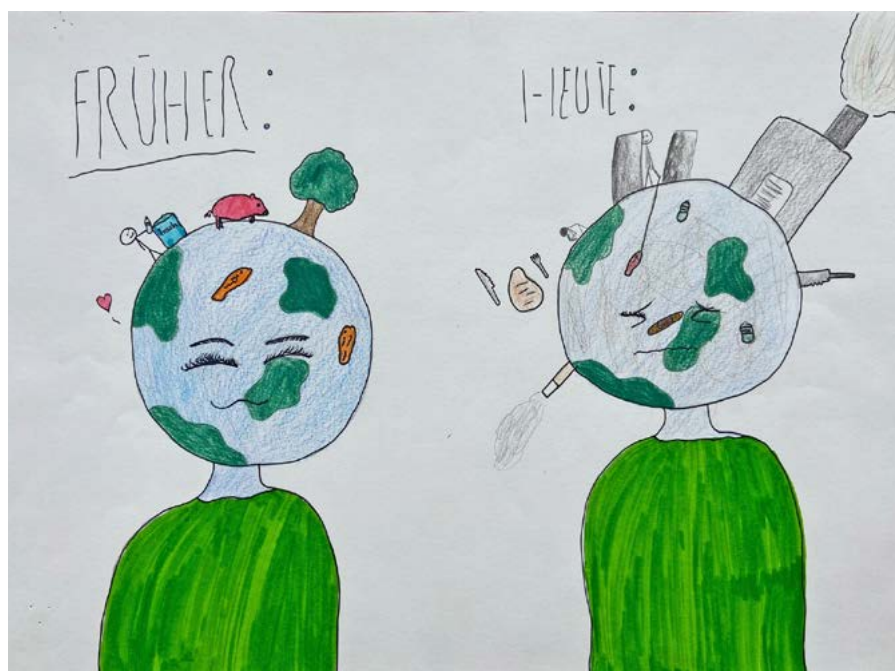
Die zwei Siegerplakate zum Thema Littering.