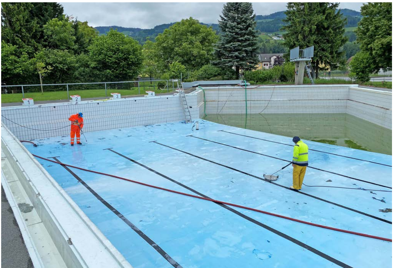
Die Vorbereitungen für die spezielle Badesaison laufen auf Hochtouren.