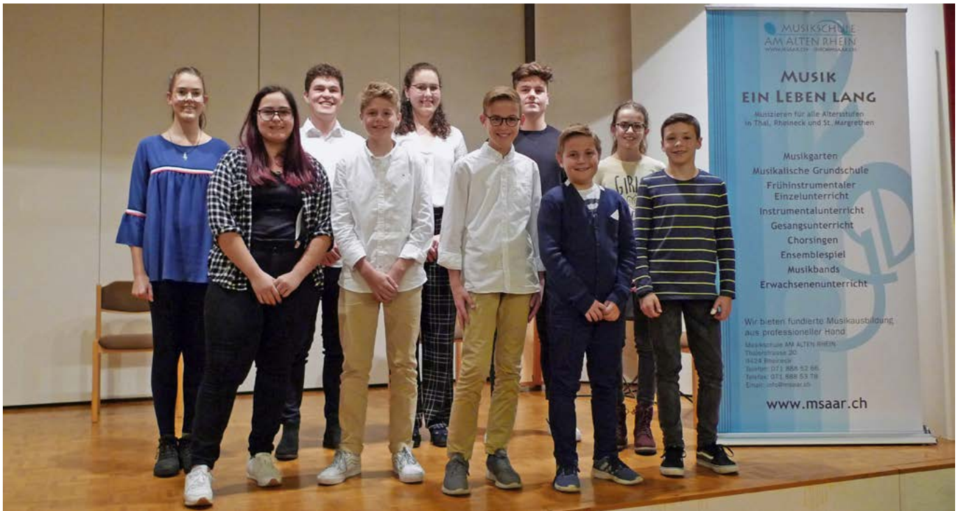
Die Musiktalente beim letztjährigen Jahreskonzert der Musikschule.