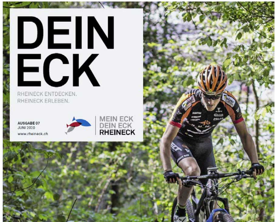
Titelbild des neuen «Dein Eck»-Magazin.