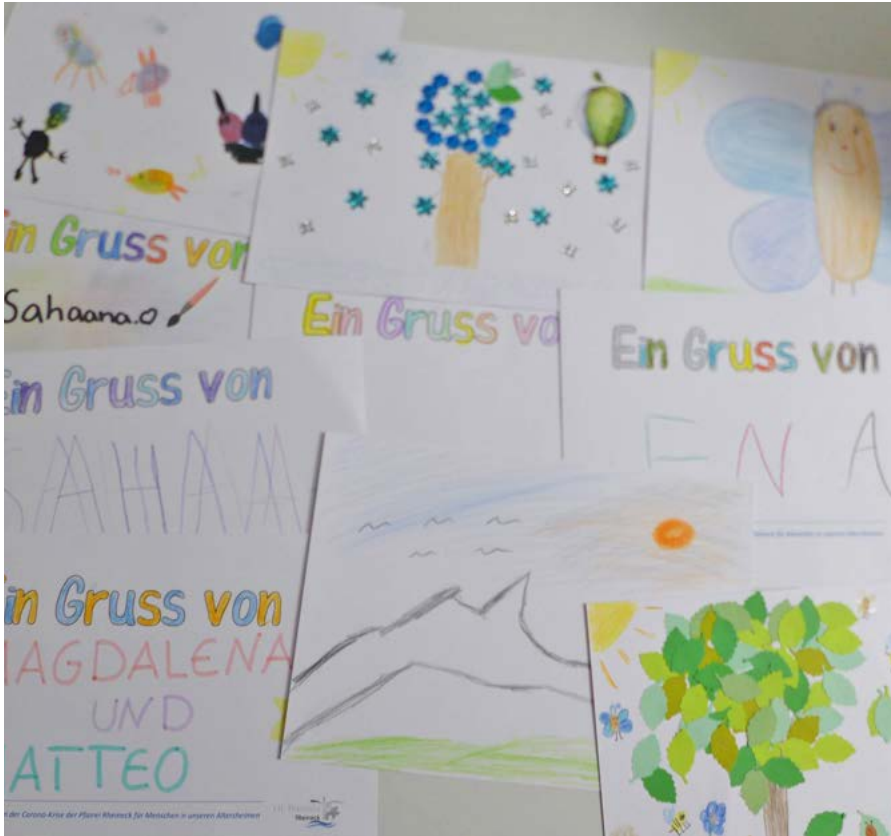
Kinder schicken Grüsse an die Bewohnerinnen und Bewohner der Altersheime Kruft und Altensteig.