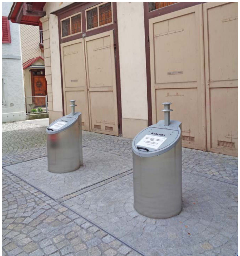
Die Unterflurbehälter beim alten Feuerwehrdepot bleiben vom 12.06. - 05.07. geschlossen

Der Entwurf sieht folgende Anpassungen vor: In Diepoldsau wird das Siedlungsgebiet für Arbeitsnutzungen und in Sevelen für sonstige Nutzungen erweitert. Aufgrund aktualisierter Grundlagendaten und einer damit einhergehenden Neuberechnung des Siedlungsgebiets verfügen die Gemeinden Sennwald und Wattwil nicht mehr über zu grosse Bauzonen – das Siedlungsgebiet in den beiden Gemeinden kann definitiv festgelegt werden. Neu sieht der Richtplan die Erstellung von räumlichen Tourismusentwicklungskonzepten vor. Zudem werden im Zusammenhang mit der Umsetzung des Zweitwohnungsgesetzes Vorgaben für die Förderung der Hotellerie, einer besseren Auslastung von Zweitwohnungen sowie zur Förderung preisgünstiger Erstwohnungen festgelegt. Das Richtplankapitel Weiler wird aufgrund geänderter Rahmenbedingungen aktualisiert. Als künftige Windparks werden die Standorte Rheinau in den Gemeinden Sargans, Mels und Vilters-Wangs