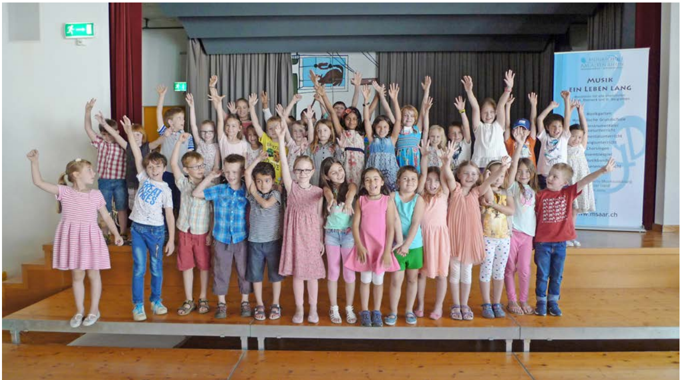
Die Teilnehmenden des Zwerglikonzerts