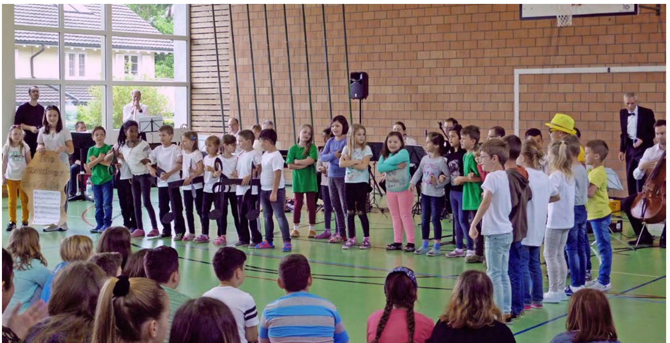
Die Aufführung des Musicals Lulu's Zaubermelodie

In wöchentlichen Proben, die im Regelfall 1 ½ Stunden dauern, wird getreu dem Motto „Es ist nie zu spät“ mit viel Spass musiziert. Fachlehrpersonen kümmern sich um die Details wie den richtigen Ansatz oder die Technik am Instrument. Die Semestergebühr beträgt 400.- Fr. Anmeldungen sind ab sofort über die Musikschule (Tel: 071 888 52 66, info@msaar.ch) möglich. Gerne erteilt der Schulleiter unter 071 888 53 79 weiterführende Informationen.