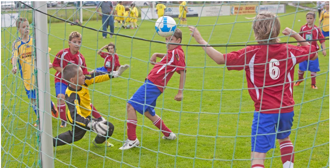
Das diesjährige Grümpeltturnier des FC Rheineck und FC Staad findet am 22. Juni auf dem Sportplatz Bützel statt

Noch sind nicht alle Kosten gedeckt. Wenn auch Sie uns unterstützen möchten, dann nehmen Sie mit uns Kontakt auf. Wir freuen uns über jede Spende. (Tel. 071 888 04 42 zu den Öffnungszeiten oder per Mail ludorheineck@bluewin.ch)