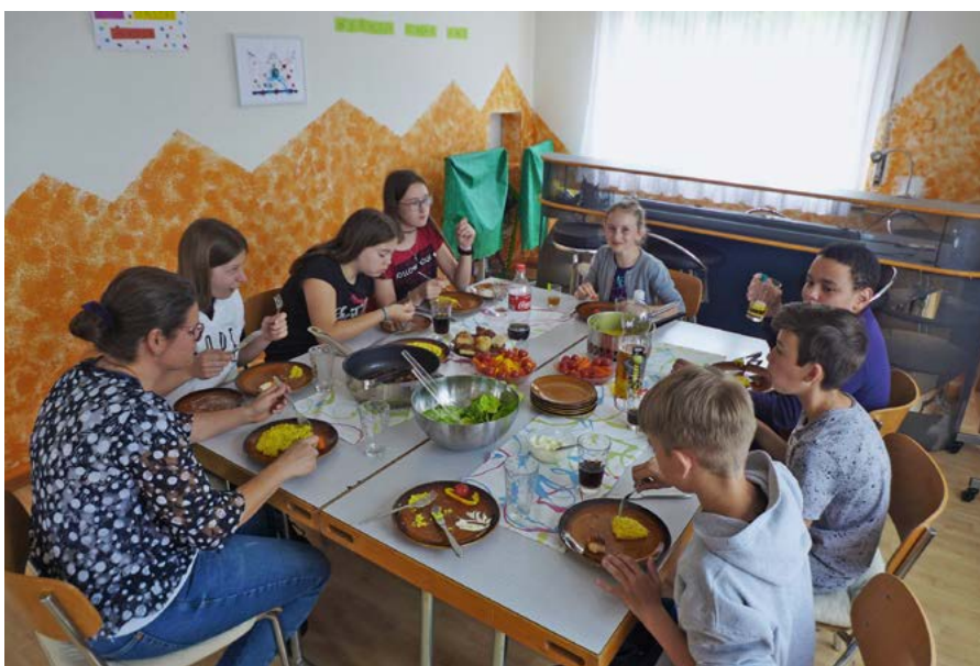
Start des neues Projektes Cook & Chill im Pfarrhaus

Im Mai hat dieses neue Projekt mit Freude und Erfolg gestartet. Am Mittwoch, 20. Juni sind alle SchülerInnen von der 4. - 9. Klasse zu einem einfachen Zmittag im Pfarrhaus eingeladen. Anschliessend bis 15.00 Uhr Zeit zum freien Spiel und zum Chillen. Anmeldungen bis Montagabend an das Kath. Pfarramt.