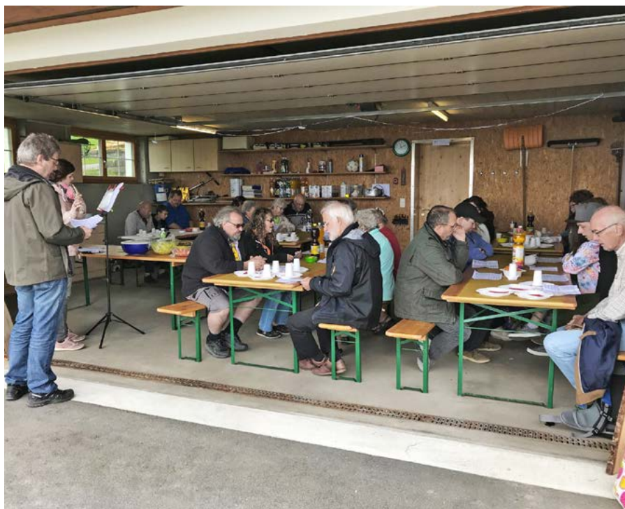
Eine bunte Schar von Jung und Alt traf sich an Auffahrt zum Gottesdienst mit anschliessendem Grillplausch