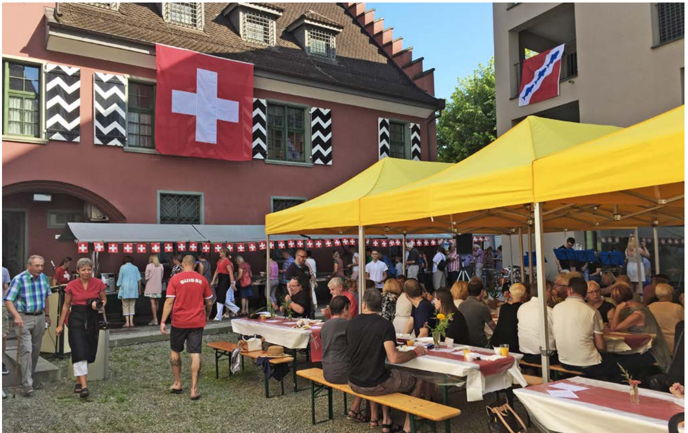
Der letztjährige 1. August-Brunch war gut besucht

sowie Krinau in den Gemeinden Wattwil und Mosnang festgelegt. Aktualisierungen aufgrund neuer Erkenntnisse, geänderter Verhältnisse oder neuer Bedürfnisse werden auch in anderen Richtplankapiteln vorgenommen: bei den Vorranggebieten Natur und Landschaft, bei den Strassen sowie beim Langsamverkehr, bei den Abbaustandorten und bei den Deponien.