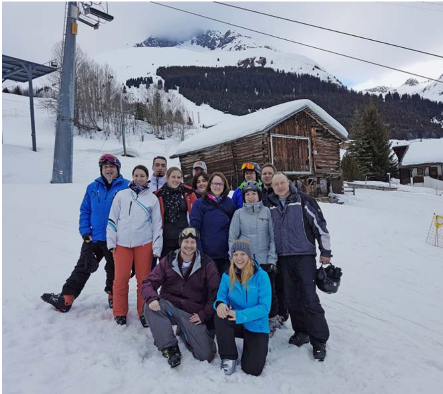
Der STV Rheineck am diesjährigen Skiweekend in Sedrun

Mitgliedern unserer Bibliothek bietet sich somit „gratis“ Zugang zu elektronischen Bibliotheksmedien wie E-Books, E-Papers, E-Audios, E-Music und E-Videos.