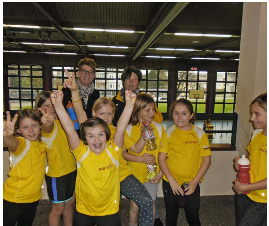
Die Jugendriege am Ki-Fu-La-Wettkampf 2018

Impressionen von diesem Tag und die Rangliste finden Sie auf www.tvr-rheineck.ch .