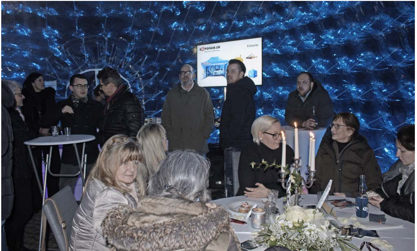
Der KMU-Neujahrsapéro fand dieses Jahr bei der Firma Expofair statt

zeitgleich seine seit 2016 in Rheineck ansässige Firma vor. Expofair AG gehört zu den führenden Anbietern für aufblasbare Werbeträger wie z.B. die bekannten Schoggi-Goldhasen. An den drei Lagerstandorten in Rheineck ist das Eventmaterial von Kunden wie Appenzeller Käse, Corona, Guinness, Hyundai, Kantonalbanken und weiterer Kunden auf über 2'000 m 2 eingelagert.