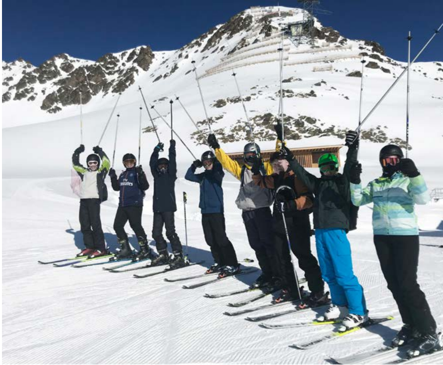
Die Oberstufenschüler am diesjährigen Skilager in Celerina