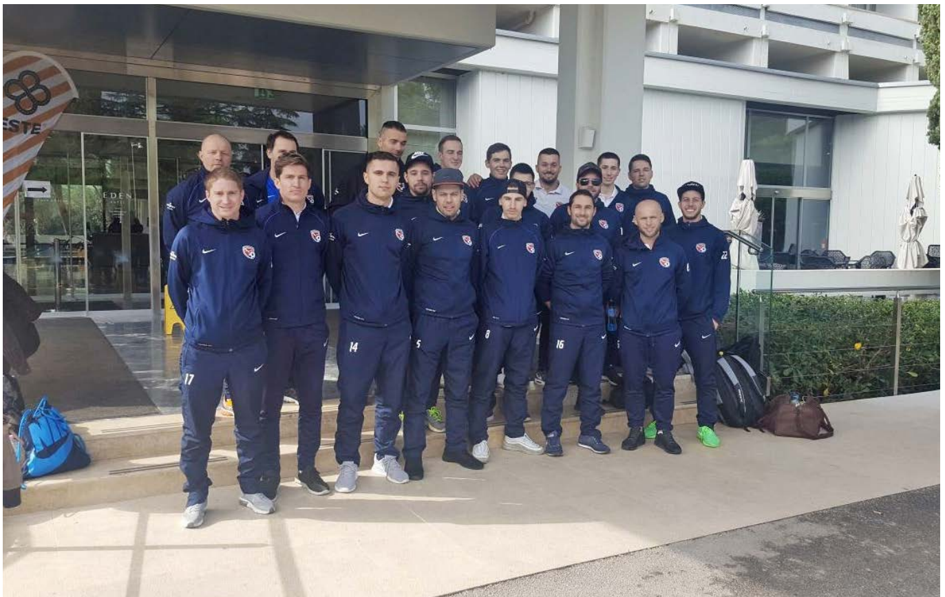
Die 1. Mannschaft des FC Rheineck hat das Trainingslager in Kroatien erfolgreich abgeschlossen